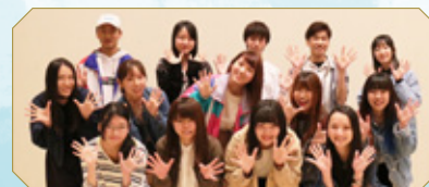
京都造形芸術大学「アリスの森」学生プロジェクトチーム

対象: 「不思議の国のアリス」の子どもチケットを購入されたお子様及びその保護者(原則)。 料金: 500円(材料費) 定員: 50組程度まで 申込方法: 「不思議の国のアリス」チケットをご購入の上、受付期間内に京都芸術劇場ウェブサイトの専用フォームからお申込下さい。 http://k-pac.org/ 受付期間: 2018年7月6日(金)10:00~7月30日(月)17:00 *但し定員に達し次第、受付終了いたします。